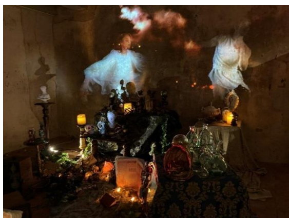
Sortilèges amoureux