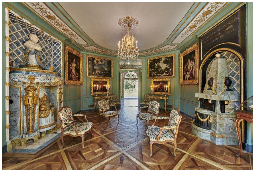
Château de Voltaire, salon

Depuis 2020, quelques pièces de l'étage noble dont le salon d'axe accueillent des expositions thématiques, en complément de la visite historique.