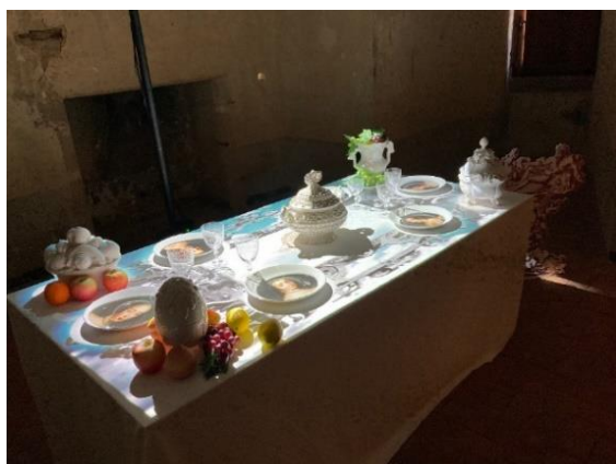
Le banquet merveilleux