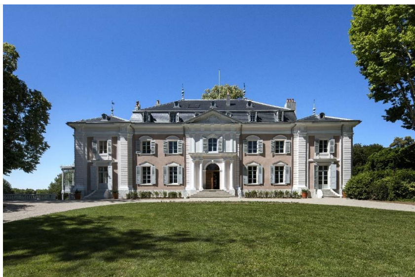
Château de Voltaire, façade sur cour

L'Etat acquiert en 1999 le château de Ferney, ce lieu de mémoire où Voltaire a tant écrit pour la défense des droits de l'homme. Les visiteurs de tous horizons viennent rendre hommage au patriarche et y trouver l'inspiration.