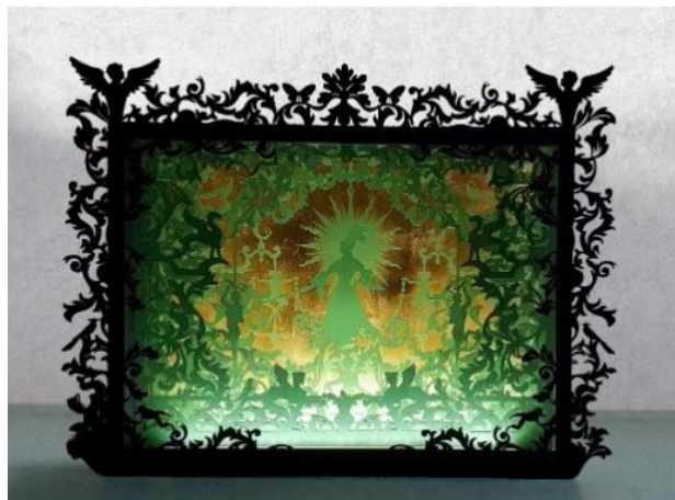
Jérôme Pellerin, Somnium hortus (jardin du songe) © Jérôme Pellerin