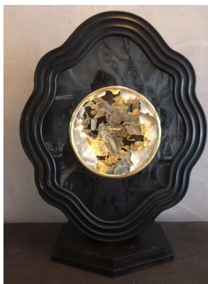
Sébastien Simon, La destruction du palais , 2022 © Sébastien Simon