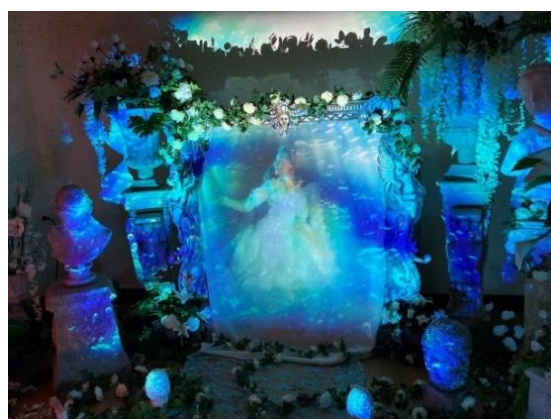
Jardin d'illusions