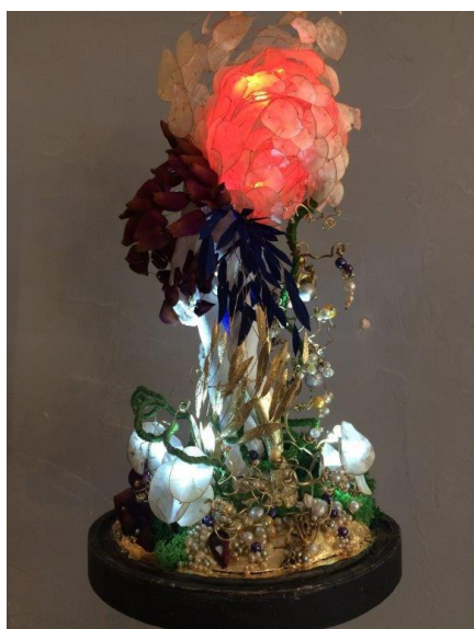
Sébastien Simon, Au cœur du jardin , 2022