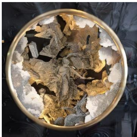
Sébastien Simon, La destruction du palais (détail), 2022