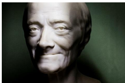
Portrait au naturel de François-Marie Arouet de Voltaire

De cette retraite éloignée, il s'enflamma contre l'injustice de la société et prit la défense des victimes de l'intolérance politique et religieuse. Il poursuivit intensément son œuvre littéraire et publia, entre autres, le Dictionnaire Philosophique , le Traité sur la Tolérance , plusieurs tragédies et pièces de théâtre. Sa correspondance depuis Ferney s'éleva à quelques 6000 lettres.