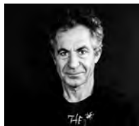
ÉTIENNE KLEIN grand témoin de l'édition 2022 des Assises

« À force de traiter la nature comme si elle était à notre seule disposition, nous l'avons peu à peu abîmée. D'aucuns, confondant les enseignements des sciences avec ce qu'ils rendent possible, réclament que nous liquidions l'esprit de la science au motif de notre mauvais usage du monde. Mais est-ce avec la physique d'Aristote que nous stabiliserons le climat ? Avec la biologie de Pline l'Ancien que nous préserverons la biodiversité ? Plutôt que de délaisser l'idée de rationalité, ne serait-il pas plus judicieux de la refonder afin qu'elle ne puisse plus servir d'alibi à toutes sortes de dominations ? Puissent les Assises 2022 nous guider dans ce travail de refondation. »