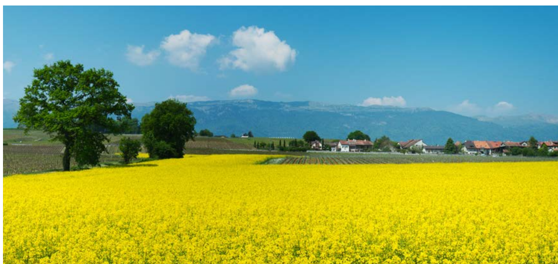
Terres agricoles dans le canton de Genève.