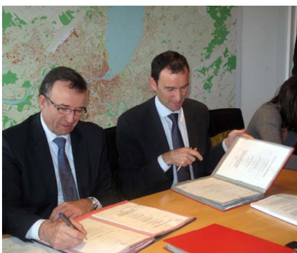
Signature de l'Accord de prestations par M. Mark Muller, conseiller d'Etat de la République et canton de Genève pour le compte du partenariat franco-valdo-genevois.

Les premières réalisations concrètes du Projet d'agglomération franco-valdo-genevois vont voir le jour dès 2011. Elles matérialiseront les travaux conduits par le Projet d'agglomération franco-valdo-genevois depuis 3 ans.